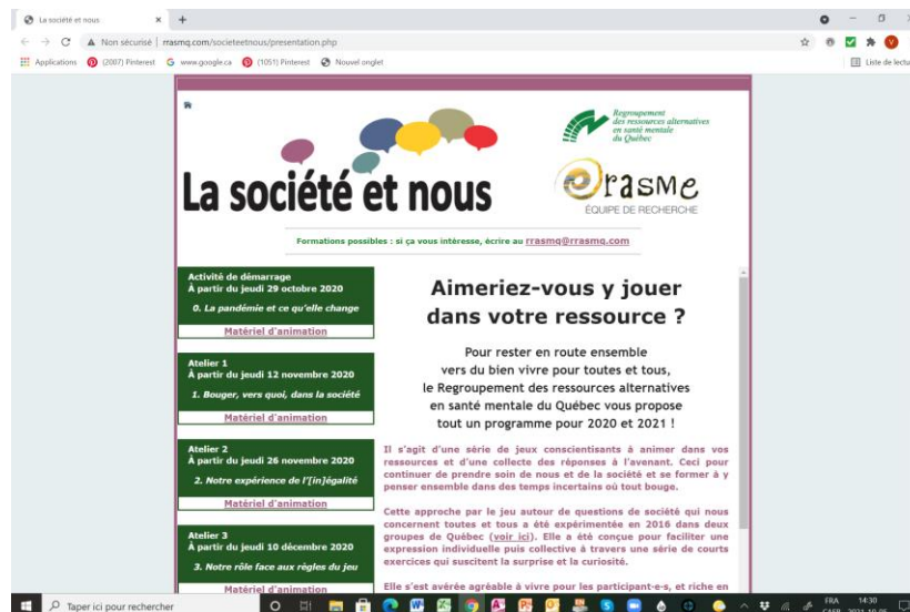
Page du site du RRASMQ donnant accès à l'ensemble de la trousse en ligne.

Ensuite, comme il devenait évident qu'il n'y aurait pas moyen de prévoir une tournée d'animations et de formations en personne dans diverses ressources, nous avons choisi de miser sur une caractéristique des activités que nous avons déjà remarquée : la meilleure façon d'apprendre à les animer est de les vivre soi-même. Pourrions-nous organiser une série d'animations/formations à l'animation en ligne ? Après un essai-test sur la nouvelle animation « La pandémie et ce qu'elle change » avec l'équipe du RRASMQ, nous avons fait le pari que oui. Ce qui conduisait à modifier en conséquence la trousse d'animation pensée en mode papier pour en faire une trousse en ligne 3 .