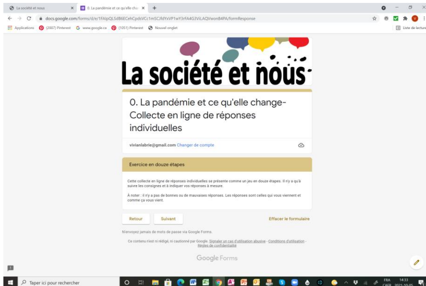
Exemple des outils en ligne développés pour recueillir les réponses des participant·e·s.

De même, la distance nous a donné le coup de pouce nécessaire pour développer un outil de réponse en ligne, à remplir par les animateur·e·s et/ou les participant·e·s sur un formulaire google, ce qui a permis d'automatiser la compilation des réponses et de faciliter leur versement dans une base de données Filemaker pour l'analyse.